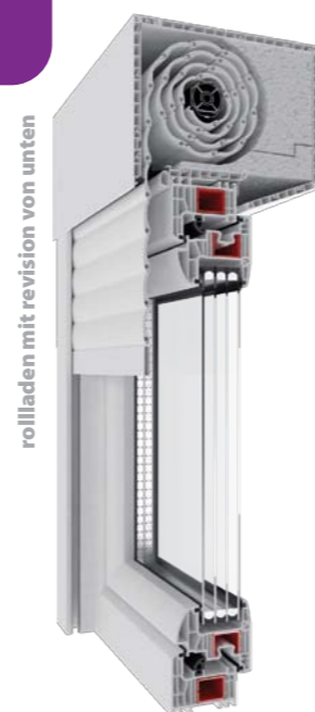
rollläden mit revision von unten

Vorbaurollläden aus PVC sind in das Fenster integriert und können bereits beim Bau des Hauses oder auch später bei einem Austausch der Fenster nachgerüstet werden. Eine reiche Farbgebung von Kästen und Führungsschienen aus Kunststoff und Panzern aus Aluminium und die verschiedenartigen Antriebs- und Sicherheitsvarianten erfüllen jede Erwartung des Kunden.