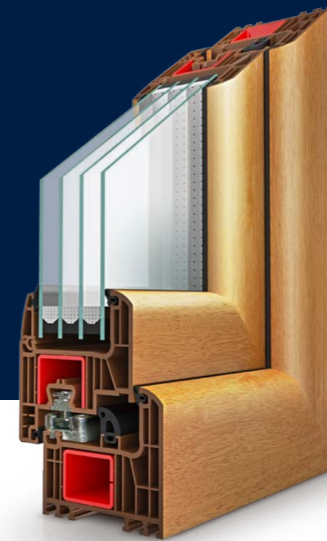
IGLO ENERGY CLASSIC

Perfekte Widerstandsfähigkeit gegen Windlast durch optimale - Verstärkung.